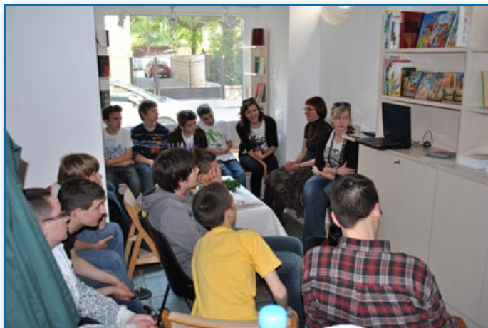
Veroučna skupina gleda video o Mojzesu, ki daje Izraelcem navodila o pripravi pashe.