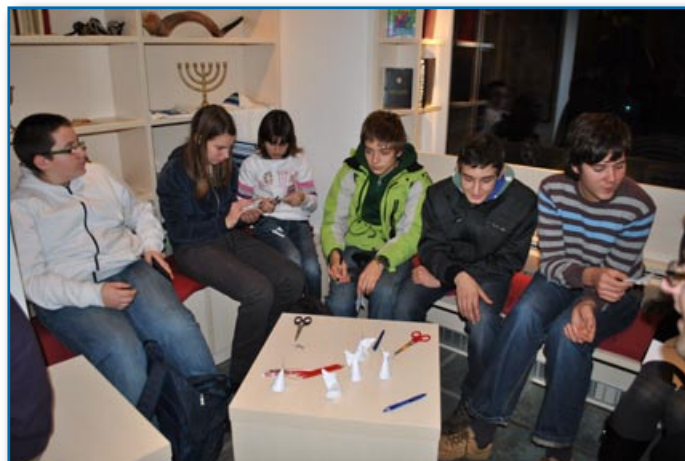
Podoben dogodek smo pripravili tudi za božič: veroučna skupina izrezuje okraske iz papirja.