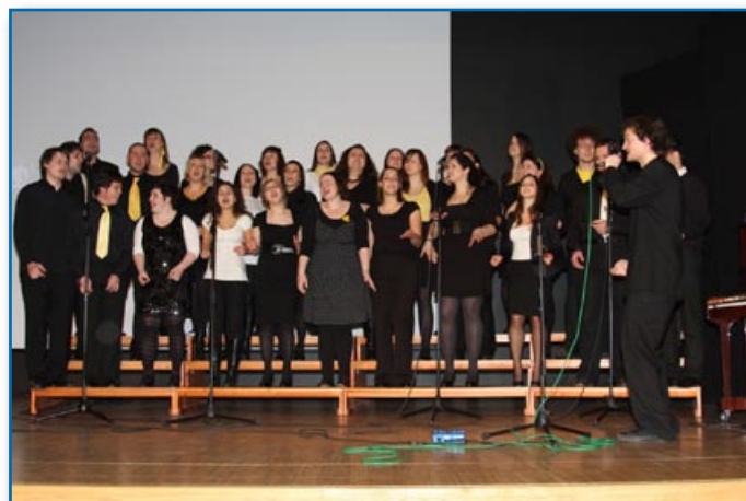
Zbor Bee Geesus

»Alleluia for the joy, joy comes in the morning ... Že vse od petka zvečer si pojem in žvižgam to pesem ter se zahvaljujem za veselje, veselje, ki pride zjutraj, veselje in radost, ki nam jih Bog pošilja brezplačno. V petek, 21. 1. 2011, nam je v Antonovem domu na Viču to veselje po žilah pognal a capella zbor Bee Geesus. Noge in roke se niso mogle upreti poplesavanju in ploskanju ob go-