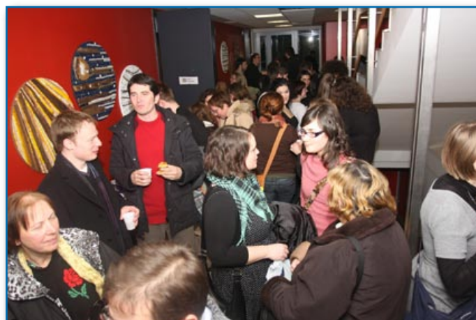
Druženje kristjanov iz različnih cerkva