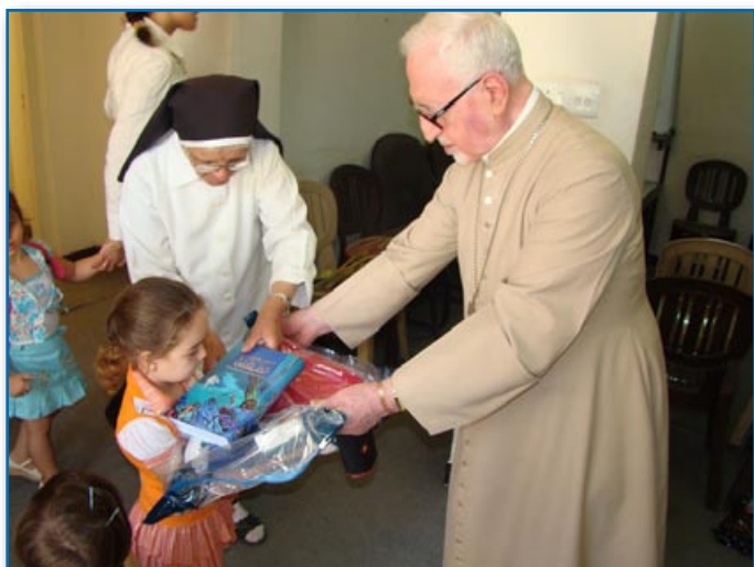
Dajenje paketov pomoči s Svetimi pismi v Iraku

spel pesmih, ki so spremljale predstavitev dobrodelne pobude Svetopisemske družbe za pomoč preganjanim kristjanom v Iraku. V času pred koncertom smo spremljali dogajanje na nemirnem področju po sredstvih javnega obveščanja, a več kot kak globok vzdih nam verjetno ni ušel. Tako se je rodila ideja, da bi druženje kristjanov različnih cerkva začinili z dobrodelno gesto. Ta večer se mi je v spomin najbolj vtisnila fotografija treh sodelavcev iraške svetopisemske družbe, na kateri se nahaja tudi duhovnik, ki so ga ubili med vdorom v cerkev, ki smo ga lahko videli pri poročilih na televiziji. Ker namen dobrodelnega večera ni bil vzbuditi odpor do napadalcev, smo predstavitev solidarnostnega projekta zaključili z molitvijo za preganjane kristjane in dodali molitev za agresorje. Božje kraljestvo od nas zahteva edinost. Ne samo edinost tistih, ki se ob veseli glasbi in dobrem pecivu srečamo v tednu za edinost kristjanov, ampak tudi tistih, ki so ogroženi ali pa ogrožajo sobrate. Naj bo molitev tisto orožje, ki prinaša mir v srca in nas vzgaja za milost in odpuščanje.«