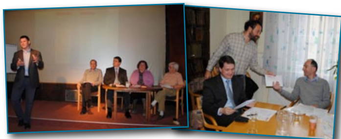
Predstavitve pobude na Občnem zboru in Upravnem odboru

Triindvajsetega marca smo imeli pri Sv. Jožefu v Ljubljani občni zbor, kjer smo navzočim članom prvič predstavili začetek kampanje Berem Besedo , s katero želimo preobraziti slovensko (ne)kulturo rednega branja Svetega pisma. Že nekaj let namreč poudarjamo, da gre pri trenutni gospodarski, politični in družbeni krizi za širši odraz duhovne revščine, ki izvira tudi iz t. i. »biblične nepismenosti«. To pomeni, da večina ljudi ne pozna, ne bere in ne razume Svetega pisma. Med njimi so žal tudi mnogi, ki se prištevajo med kristjane, pa vendar niso v živem stiku z Božjo besedo, saj jih ta ne nagovarja, ne izziva in ne oblikuje njihovih življenj. Odpraviti ta temeljni primanjkljaj v naši družbi ne bo lahko. Zato menimo, da bo morala kampanja Berem Besedo trajati več let, da bi dosegla svoj cilj – čimveč ljudi pozvati na pot rednega branja Svetega pisma.