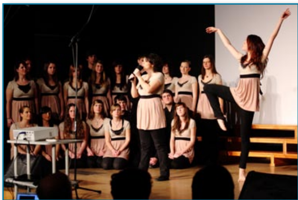
Nastop zbora Pala