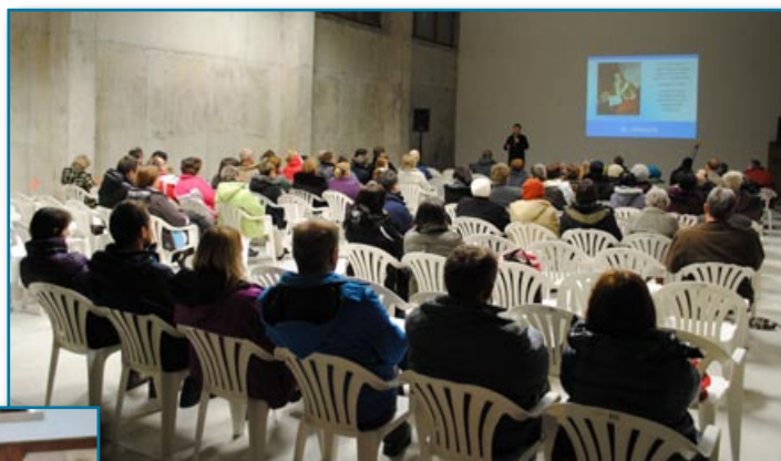
Berem Besedo župniji Dolenji Logatec

Pobudo smo začeli predstavljati tudi ob obiskih župnij s pričevarjskim predavanjem z naslovom Berem Besedo: S Svetim pismom iz tradicionalne k osebnim veri . Tako smo doslej obiskali župnije Prebold, Trbovlje, Gomilsko, Logatec, Olimlje ter Škocjan. S pomočjo ankete, ki jo izvedemo na koncu predavanja ugotavljamo, da se velik odstotek poslušalcev z veseljem odzove pobudi in se odloči, da bo sledil izzivu Mojih trideset dni s Svetim pismom . Pri tem opažamo bistveno spremembo v primerjavi s prejšnjimi predavanji, ko ob povabilu k branju Svetega pisma za poslušalce nismo imeli konkretnega izziva; sedaj jim seznam vnaprej pripravljenih odlomkov precej olajša odločitev. Zaenkrat še nismo izmerili, koliko ljudi je celoten izziv dejansko izpeljalo.