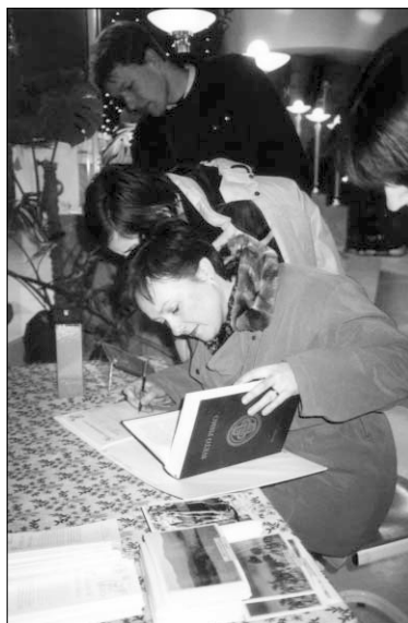
Verniki župnije Stožice ...

Namen vpisovanja svetopisemskih vrstic. Kratek odlomek iz Svetega pisma bo postal del naše prave »rokopisne Biblije«, ki jo bomo skupaj pisali skozi vse leto 2000. Tako bomo uresničevali Jezusovo naročilo: »Kar ste storili kateremu mojih najmanjših bratov, ste meni storili« (Mt 25,40). Veriga naših svetopisemskih vrstic bo postala tudi vez ljubezni in edinosti med slovenskimi in malgaškimi kristjani.