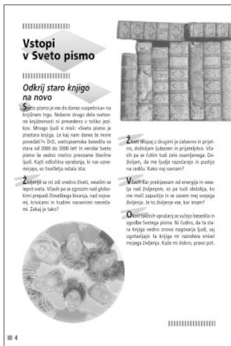
Ena izmed uvodnih strani

Zadnje poglavje, Kako brati in razumeti Sveto pismo – nekaj koristnih napotkov , nam prinaša tri praktične pripomočke pri branju. Prvi je časovni trak, na katerem je upodobljenih dva tisoč let svetopisemske zgodovine. Sledi načrt branja Svetega pisma, ki nam za vsak dan v letu predlaga določen krajši odlomek iz Svetega pisma, tako da se v enem letu seznanimo z najpomembnejšimi svetopisemskimi besedili (bralci, ki bi v enem letu hoteli prebrati celotno Sveto pismo, lahko na Svetopisemski družbi dobijo drug, obsežnejši seznam). Poglavje in s tem celotno knjigo pa zaključijo pet zemljevidov, na katerih so označeni najpomembnejši svetopisemski kraji in pokrajine.