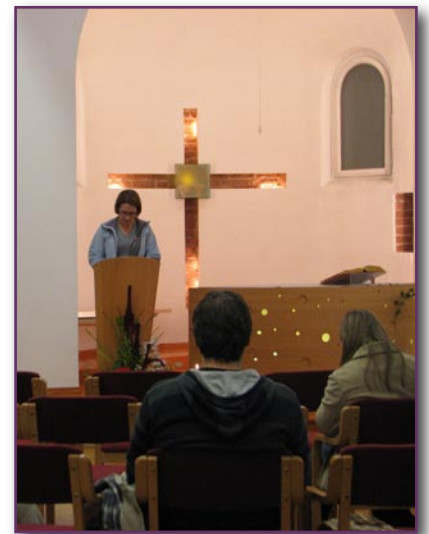
Nočno branje je mnoge še posebej nagovorilo

Iz številnih odzivov smo razbrali, da je bil maraton izjemno bogata duhovna izkušnja za številne kristjane, zanimiv pa je bil tudi za neverne, saj je bil deležen precejšnje medijske pozornosti. Z maratonom so stopila v ospredje tudi duhovna gibanja v Katoliški cerkvi, saj se je ob večerih predstavilo kar deset sodelujočih gibanj. Ob koncu maratona smo se dogovorili, da dogodek ponovimo jeseni prihodnje leto.