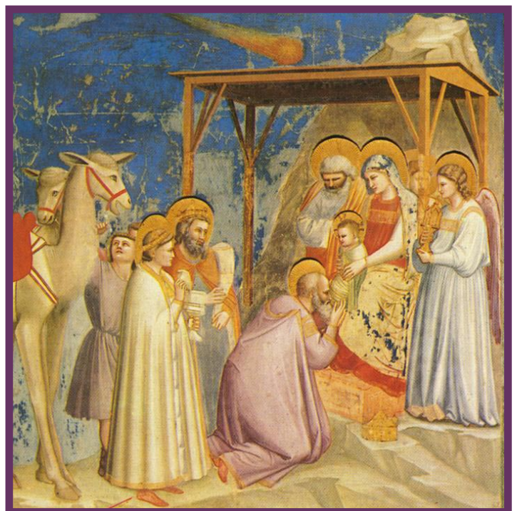
Giotto: Obisk modrih z Vzhoda